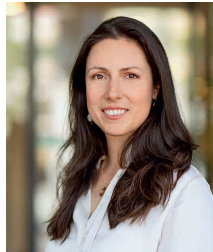
Viktória de Bourbon de Parme, beschermvrouwe van Save the Children

Tegelijk zag Viktória daar ook de hulp die mensen krijgen. "Ik mocht meelopen met gezondheidswerkers die gezinnen helpen. Ik stond zomaar in hun woonkamers, heel bijzonder. Ik was welkom omdat deze gezinnen de mensen van Save the Children vertrouwen. Dat is de manier waarop Save the Children werkt. De hulp wordt heel lokaal belegd, door jonge mensen in de gemeenschappen te trainen. Het is een gigantisch netwerk.